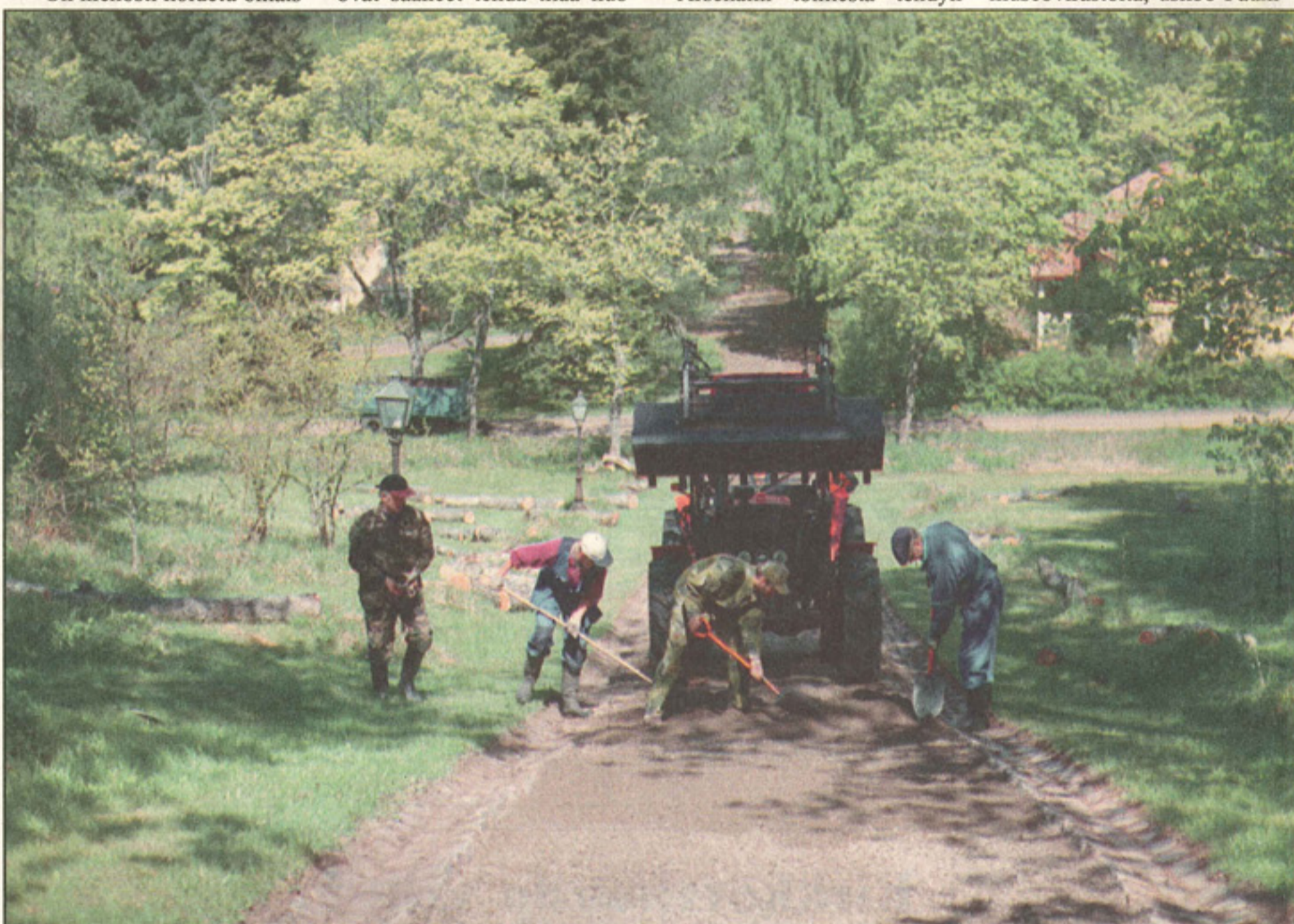
Talkooväki on saanut paljon näkyvää aikaan Teijon kirkossa ja kirkonmäellä. Kirkkotien mukulakiviset sadevesikourut on kaivettu esiin ja vanhat saarnet tehneet tilaa nuoremmille.